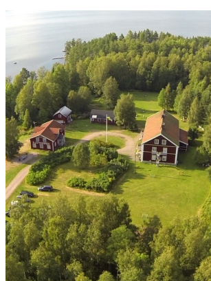
Lära känna gården