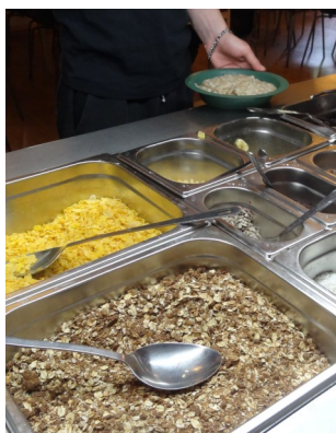
Struktur och rutiner

Fredagen den 9:e juni samlas vi klockan 07.30 vid Klarabergsviadukten precis som vid Teamhelgen (se bild på sista sidan). Ett tips är att vara utvilad och ha ätit en ordentlig frukost innan avfärden. Det är viktigt att du kommer i tid till samlingen. Bussen kommer inte vänta om någon är sen.